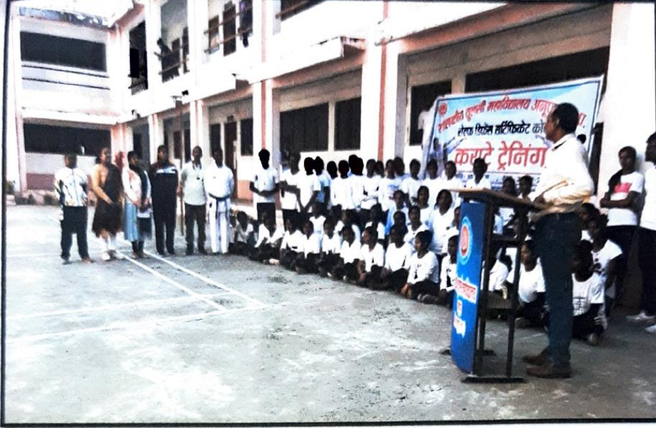
प्रशिक्षण प्राप्त विद्यार्थियों द्वारा काराटे का प्रदर्शन